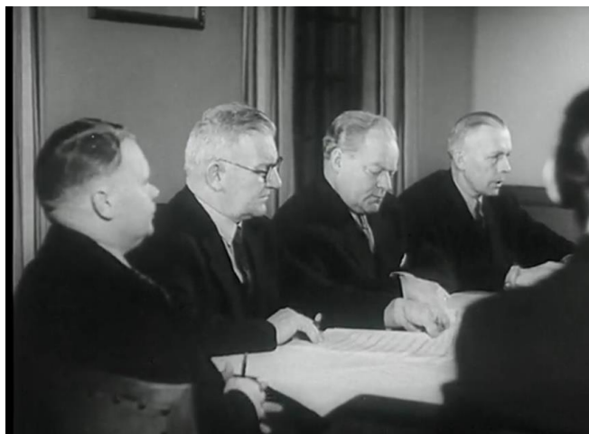
Fullmäktigeledamöter Spånga 1948.

I januari 1949 går större delen av Spånga upp i Stockholm stad, och Spånga Högerförening blir därmed också en del av förbundet Högern i Stockholm stad. Föreningen inleder detta år ett intimt samarbete med Bromma högerförening. Tillsammans beser föreningarna, under